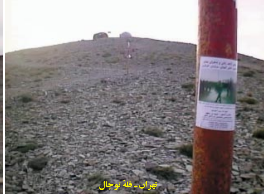
تهران - قله توجال