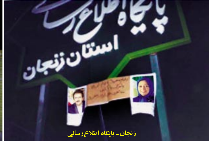
زنجان - پایگاه اطلاع رسانی