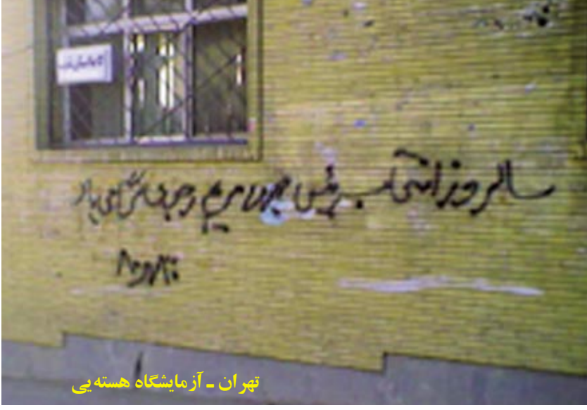
تهران - آزمایشگاه هسته‌ای