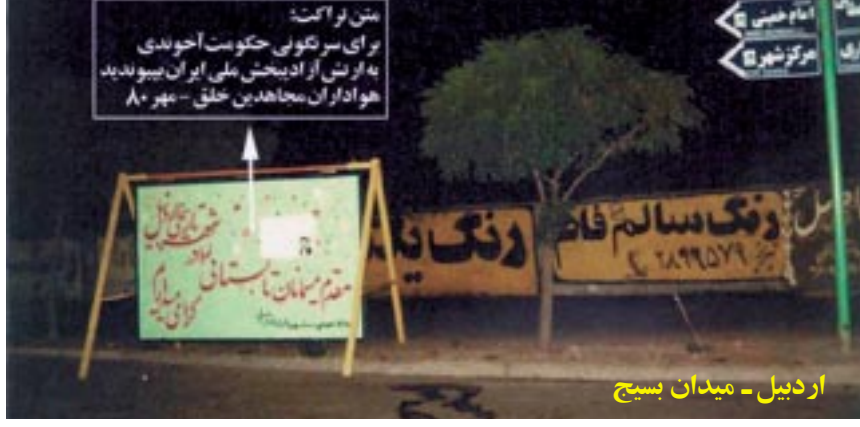
اردبیل - میدان بسیج