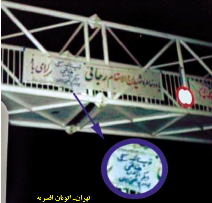
تهران - اتوبان افسریه