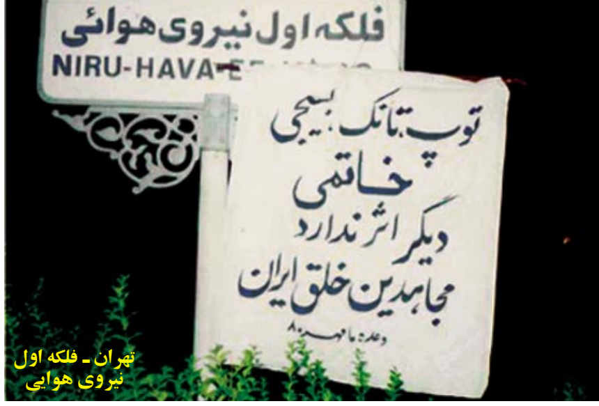
تهران - فلکه اول نیروی هوایی